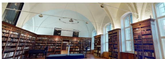
Historische Säle der Stadtbibliothek >

Es stehen bereits einige virtuelle Rundgänge durch Lübecker Museen, Kirchen und das Lübecker